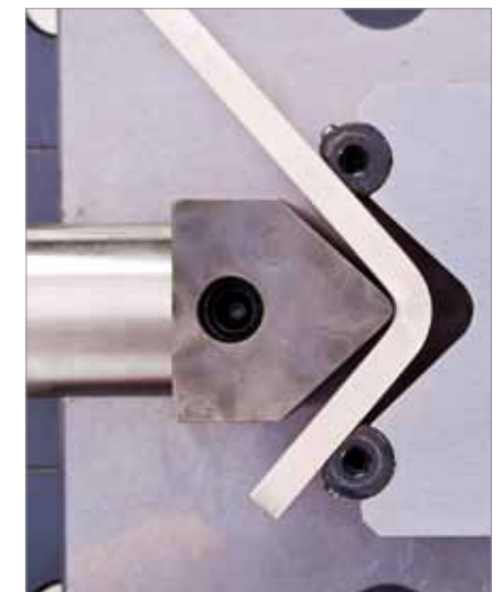
Biegen von Kupfer