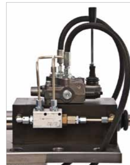
Handbedienung / Rückschlagventil