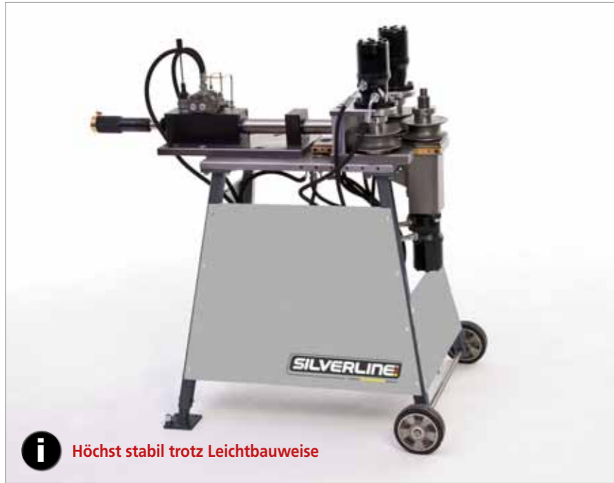
i Höchst stabil trotz Leichtbauweise