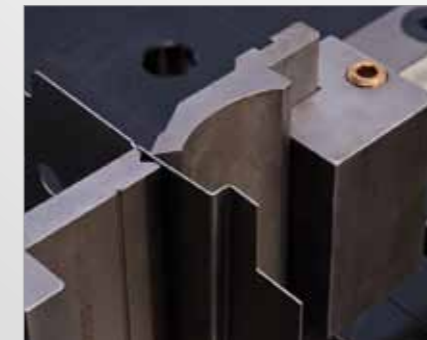
Biegen mit Stempeladapter