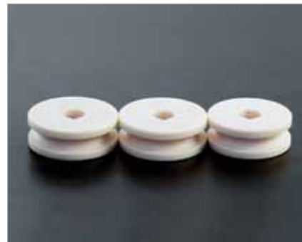
Biegerollen aus Polyamid