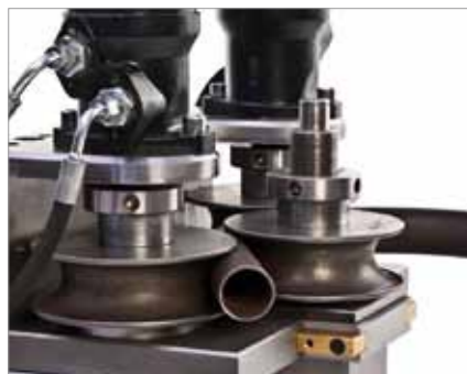
Biegeleistung bis Rohrdurchmesser 48 mm