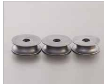
Biegerollen aus Stahl