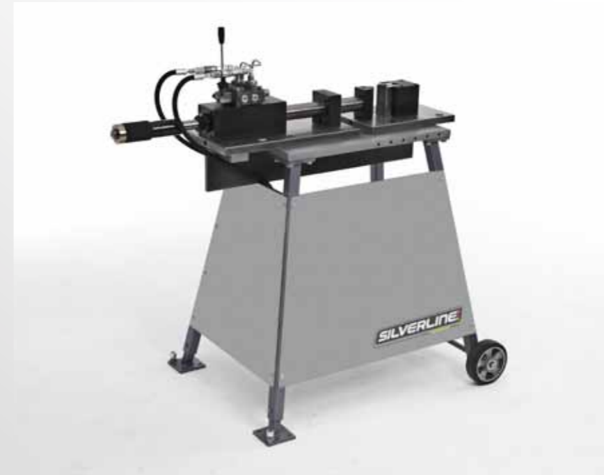
Vario 3 Hydraulischer Bieger mit 10 Tonnen

Profilbiegemaschinen gehören zur Grundausstattung eines metallhandwerklichen Betriebes. Seit Generationen sind diese Maschinen allerdings unverändert groß, unflexibel und teuer. Mit dem Vario-Bieger hat das Unternehmen Gelber-Bieger diesen Maschinentyp in allen diesen Punkten revolutioniert. Der Vario-Bieger passt sich exakt den Bedürfnissen der verschiedenen Metallgewerke an und ist je nach Ausstattung universal einsetzbar, klein und vor allem günstig. Für kleinere Existenzgründer aber auch größere Firmen ist diese Maschine, die auch perfekt auf Baustellen eingesetzt werden kann, die ideale Basis. Bisherige uns bekannte Profilbieger konnten bisher im Nachhinein vom Kunden nicht mehr verändert werden. Es gab nicht die Möglichkeit, selbige nach- oder aufzurüsten. Wenn die vorhandene Maschine nur zwei angetriebene Wellen besaß, jedoch drei Wellen (um beispielsweise Wendel zu biegen) benötigt wurden, konnte sie nicht entsprechend verändert werden. Das ändert sich jetzt: Mit den unterschiedlichen Varianten des Vario-Biegers liefert er höchste Flexibilität, denn er kann exakt an die Bedürfnisse der Kunden angepasst werden.