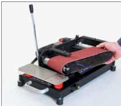
Wechseln des Schleifbandes