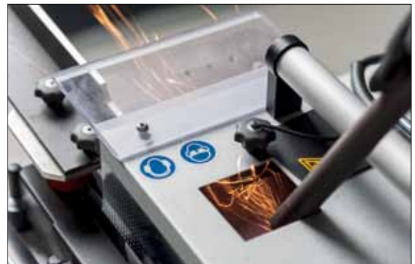
Öffnung zum Entgraten