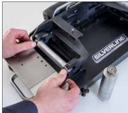
Wechseln der Kontaktrolle