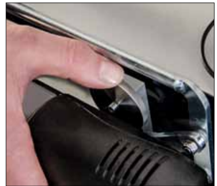
Einstellung der Bandrichtung