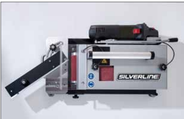
Portable Tube Grinder von oben