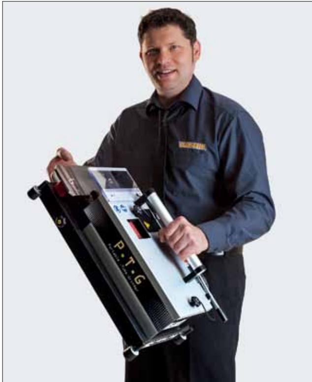
P-T-G Tragbarer Rohrausschleifer