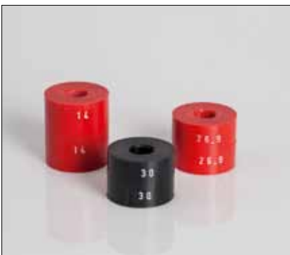
Distanzhülsen zur Höheneinstellung