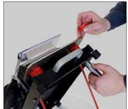
Anpassen der Schleifhöhe