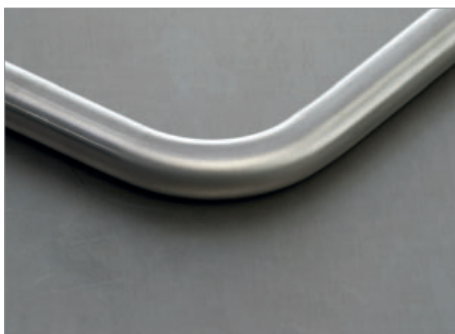
Bogen, R = 1,5 x D

Einen enormen Produktionsvorteil bietet unser standardmäßig motorisch gesteuerter Vorschub. Das im Vier-Backenfutter fest eingespannte Rohr, bewegt sich auf Knopfdruck nach vorne oder nach hinten, zur einprogrammierten Position. Das zeitraubende, händische Hin- und Hergeschiebe und die verzweifelten Versuche die exakte Position im 0,1 mm Bereich per Handverschiebung zu erreichen, entfällt.