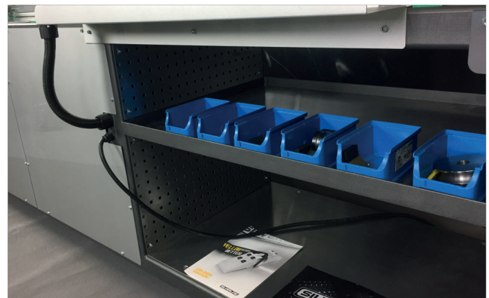
stabile Konstruktion mit Ablage