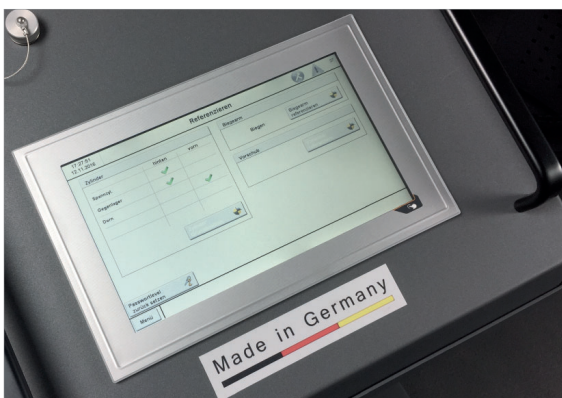
Display, 10" touch screen