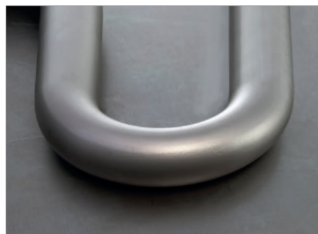
Bogen, 60 mm, 180°