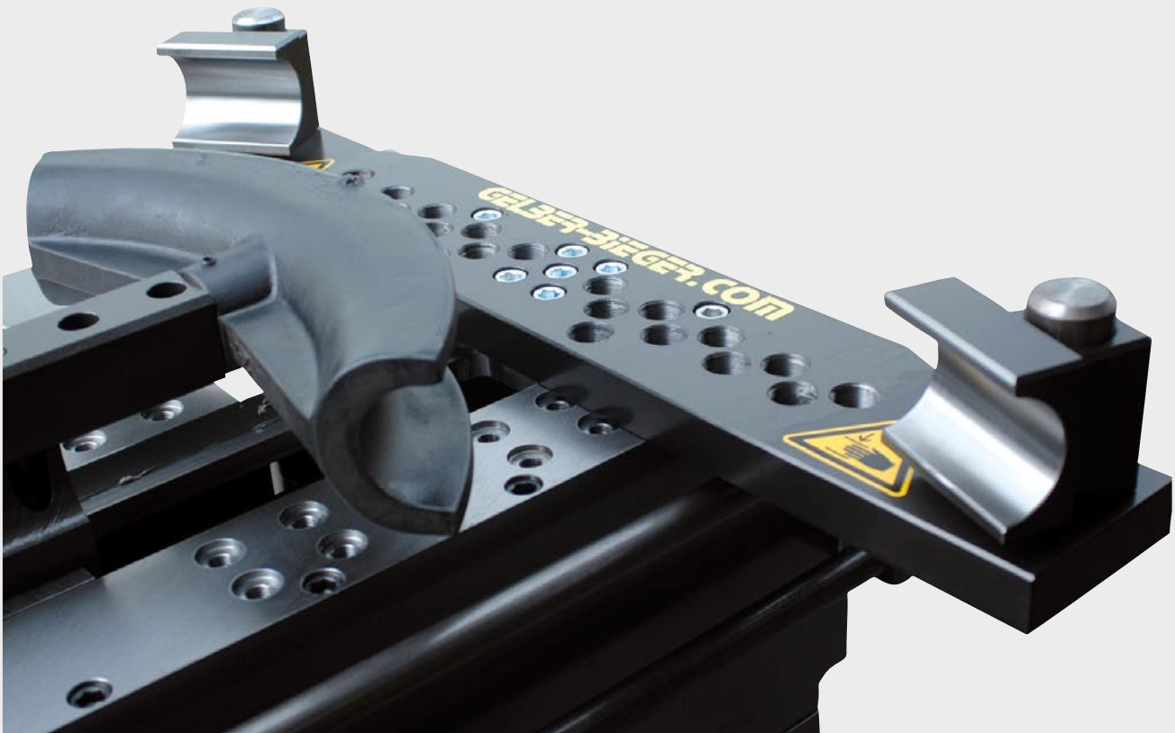
Pressbiegeeinrichtung verstärkte Version 76 mm

Das Pressbiegen ermöglicht hauptsächlich das Biegen von dickwandigen Rohren mit einem mittleren Biegeradius (4xD), um einen definierten Winkel (z. B. 90°). Zum Biegen eines Rohrs benötigen Sie für jede Rohrgröße eine Biegeform. Den Biegewinkel können Sie mit der Steuerung des Gelber-Bieger XL programmieren.