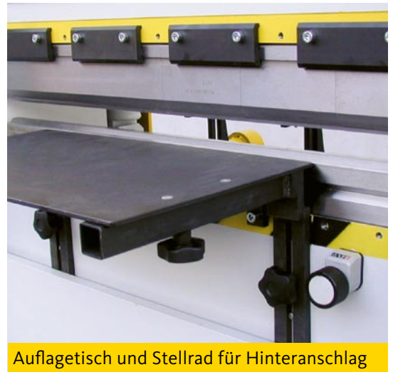
Auflagetisch und Stellrad für Hinteranschlag

Bei der Abkantpresse GB 28 besteht die Möglichkeit einen Wert zu programmieren, um einen Biegewinkel zu realisieren.