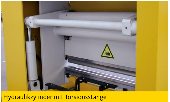
Hydraulikzylinder mit Torsionsstange